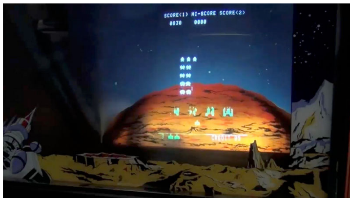
A video clip is available online .

Through this simplified explanation of technological affordances, one can begin to imagine the amount of storage and working memory required to transpose in a binary format the cinematic standard of 24 images per second, with a screen resolution equivalent to millions of pixels, where each of these pixels can be defined through millions of different hues. For instance, 4K movies as defined by the DCI digital cinema specification have a resolution of 4096 × 2160 pixels at 24 images (frames) per second, and each frame can be comprised of up to 1.3 million bytes. [2] For a full movie, this presents challenges for data transmission and storage even today. Beyond RAM