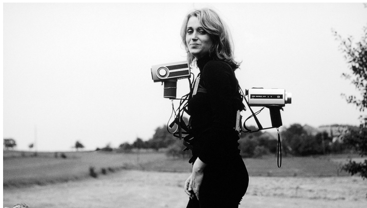
Valie Export, Adjungierte Dislokationen I + II , 1973. Voir la fiche.

Adjungierte Dislokationen de Valie Export (1973) fait partie d'une série d'exemples où l'on a fixé l'appareil de prise de vues au torse du filmeur afin de produire des relations corps-espace inhabituelles [2] . Dans cette œuvre, le corps devient une interface invisible entre deux visions de l'espace, alors qu'Export porte sur elle une paire de caméras Super 8 placées de part et d'autre de son corps (sur son torse et son dos). Indissociables du corps depuis lequel elles sont prises, les images d' Adjungierte Dislokationen exposent néanmoins l'invisibilité du corps qui n'existe que dans l'interstice entre les deux images. Du moins, ce serait le cas si l'installation de cette